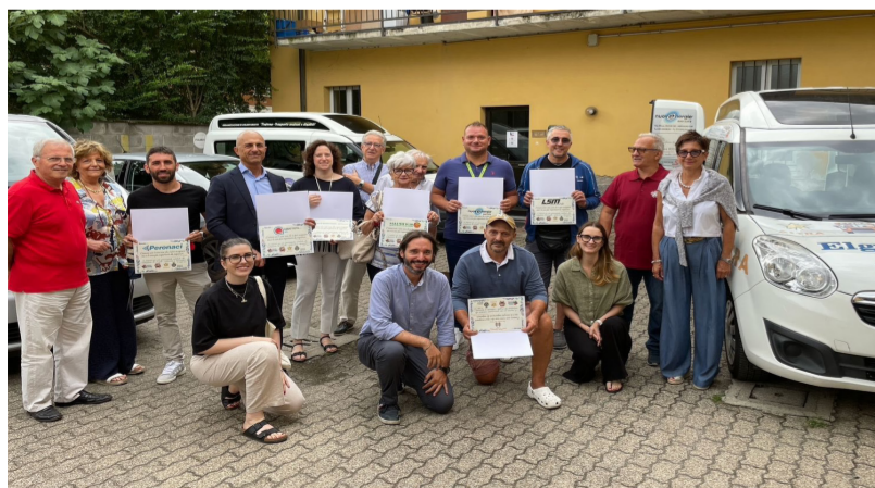
Gli sponsor del progetto

potrà così continuare a offrire i propri servizi a favore delle fasce più fragili della popolazione. Ciò è reso possibile tramite il supporto economico di realtà imprenditoriali locali, le cui sponsorizzazioni vengono esposte sulla carrozzeria del veicolo. Il valore sociale del progetto è rilevante, rappresenta un esempio virtuoso di collaborazione che porta benefici concreti ai cittadini, poiché il furgone attrezzato non è solo uno strumento di inclusione. Il mezzo rappresenta un ulteriore passo avanti per l'associazione Insieme - attiva da 25 anni a Nerviano - nel fornire supporto a persone in difficoltà. Una dimostrazione concreta di come l'unione tra privati e volontariato possa tradursi in servizi utili e accessibili per la comunità. Riserviamo un ringraziamento particolare a tutte le aziende del territorio che hanno reso possibile il realizzarsi di questa rilevante iniziativa.