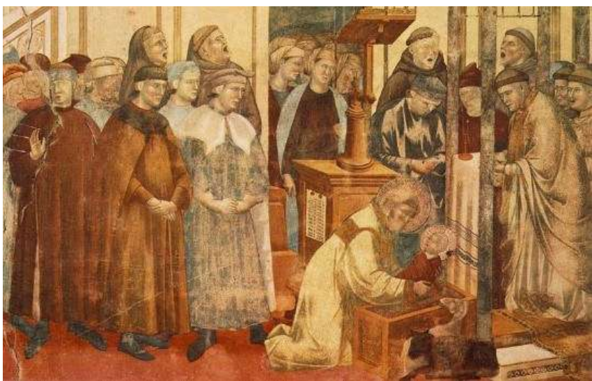
Il presepe di Greccio, Giotto, Basilica di Assisi

Francesco è ricordato per innumerevoli aneddoti che lo hanno fatto diventare uno dei Santi più amati dal popolo, ma sicuramente uno dei gesti più poetici ed evocativi che il poverello di Assisi ha compiuto è stata la ricostruzione vivente della Santa Notte: esattamente 800 anni fa.