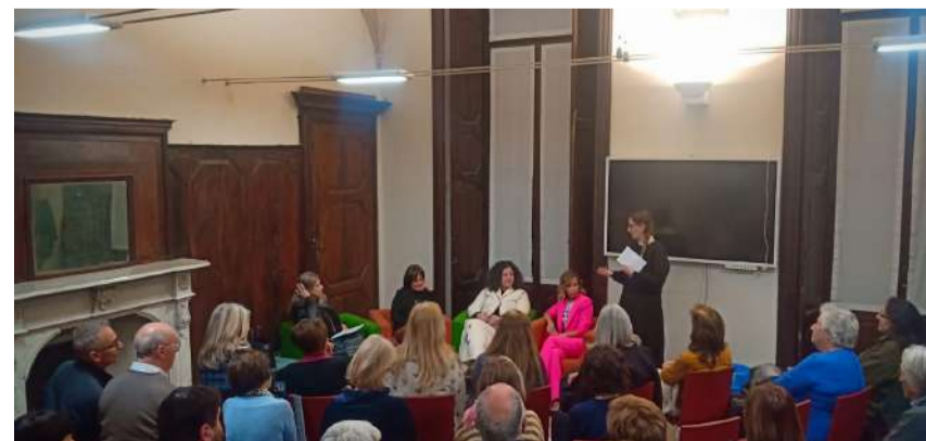
Rassegna Donne d'Impatto

non è stato indifferente. Infine ritengo importante citare lo spettacolo teatrale "Nel mare ci sono i coccodrilli" tratto dall'omonimo libro di Fabio Geda che narra la storia di un ragazzino che dall'Afghanistan intraprende un viaggio costellato di paura e solitudine con la speranza di un futuro migliore. Questo spettacolo è stato occasione importante per riflettere sul tema dell'immigrazione e dell'accoglienza delle persone. Sono ancora moltissimi i progetti che stiamo strutturando e che presto vedranno la realizzazione, sicuramente il criterio con il quale ci muoviamo è parlare di quello che accade a Nerviano, leggere la realtà da un'altra prospettiva. Non vogliamo che siano progetti, eventi, iniziative proposte dall'ente politico ma pensiamo che sia più efficace accogliere gli input che abbiamo e svilupparli. Siamo certi che Nerviano sia un luogo abitato da una comunità altruista, un territorio gentile con un'anima volta al prossimo e quindi è giunto il momento di parlare, conoscere e amare anche ciò che ci sembra lontano da noi e dal nostro modo di vivere.