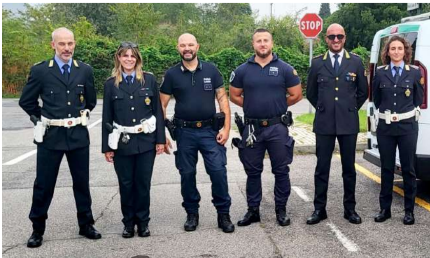
Agenti del Comando Unico di Nerviano Pogliano Milanese