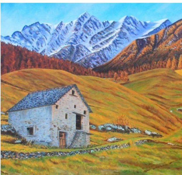
Scorcio autunnale del villaggio Simplon Dorf in Svizzera