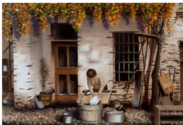
Cortile di fronte all'Hotel Dei Giardini, Vicolo Offredi