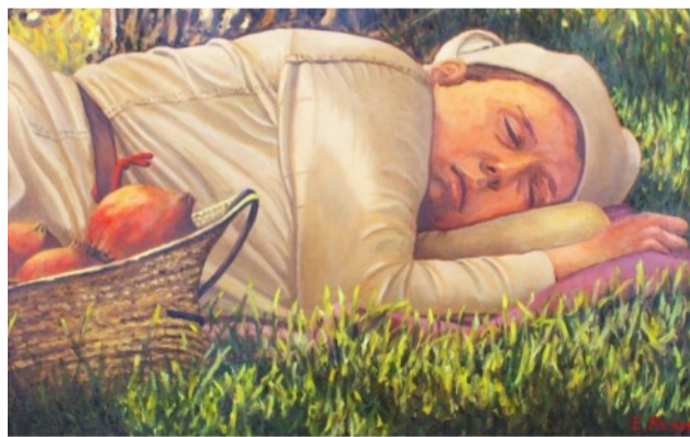
Figurante vestita da contadina della manifestazione 'Trecentesca di Morimondo'