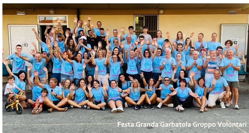
Festa Granda Garbatola Gruppo Volontari