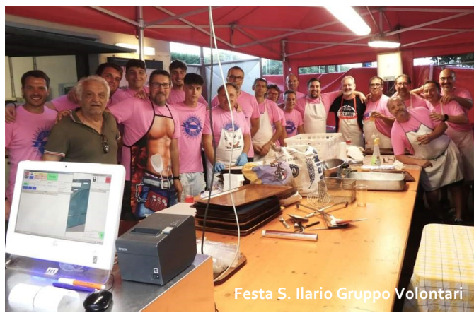
Festa S. Ilario Gruppo Volontari