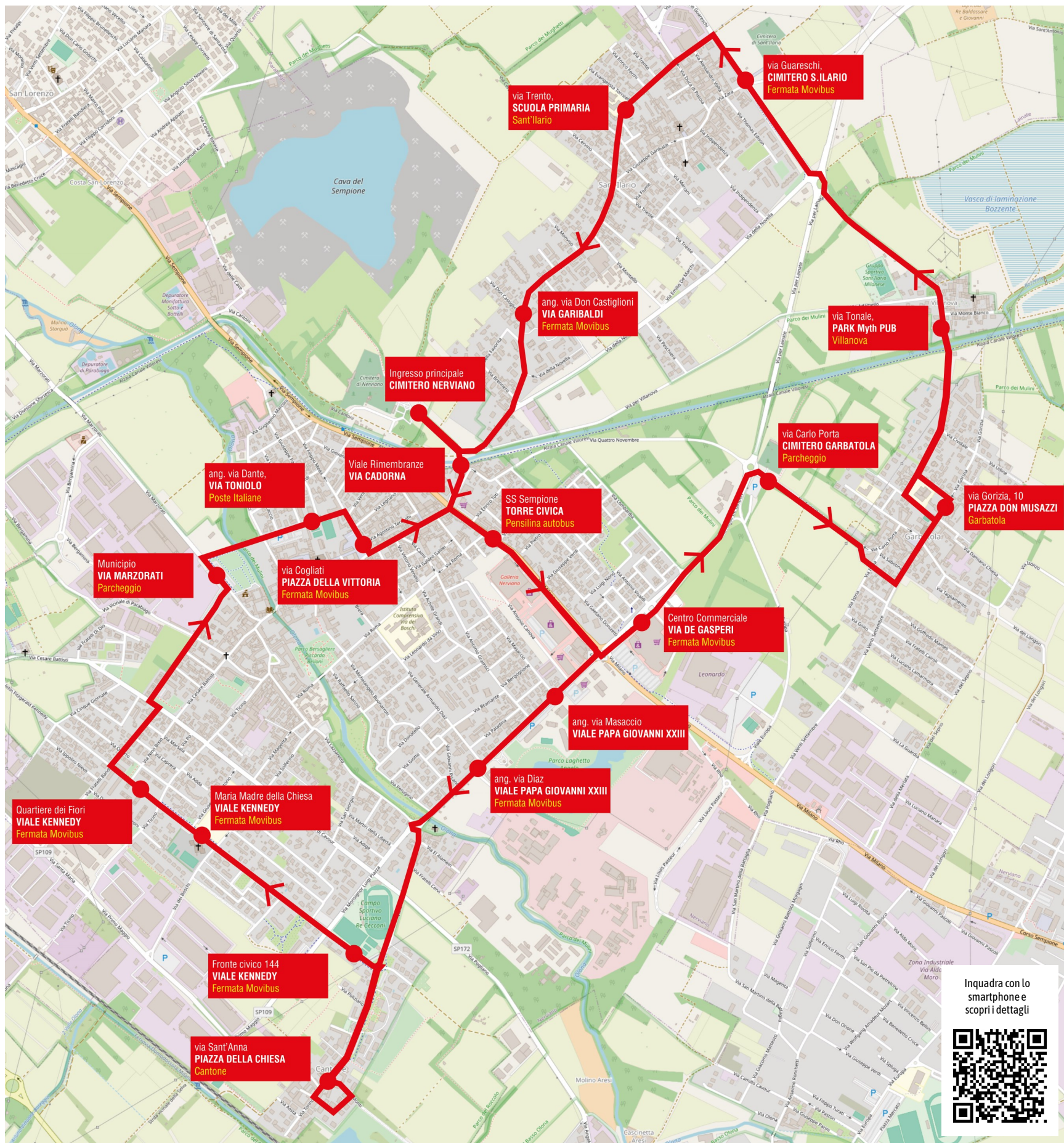
Percorso navetta cittadina

Vi invitiamo ad utilizzare questo servizio che rappresenta un importante elemento di novità per il nostro Comune; la vostra partecipazione è fondamentale per il successo e il mantenimento di questa iniziativa e per costruire insieme una città più accessibile, sostenibile e soprattutto solidale. Per maggiori informazioni sugli orari e i percorsi, vi invitiamo a consultare il sito web del Comune, le bacheche comunali e le fermate della navetta.