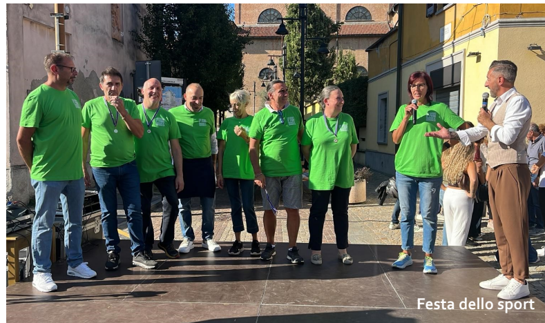
Festa dello sport