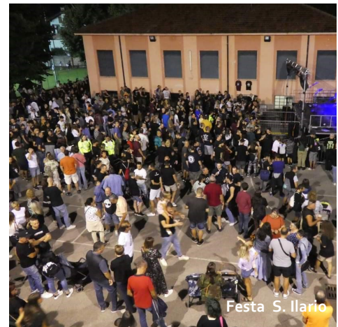
Festa S. Ilario