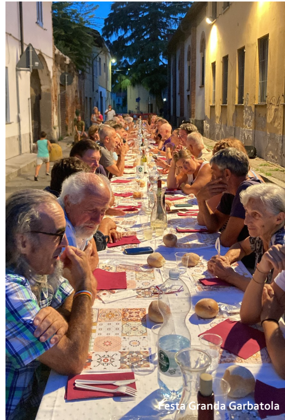
Festa Granda Garbatola