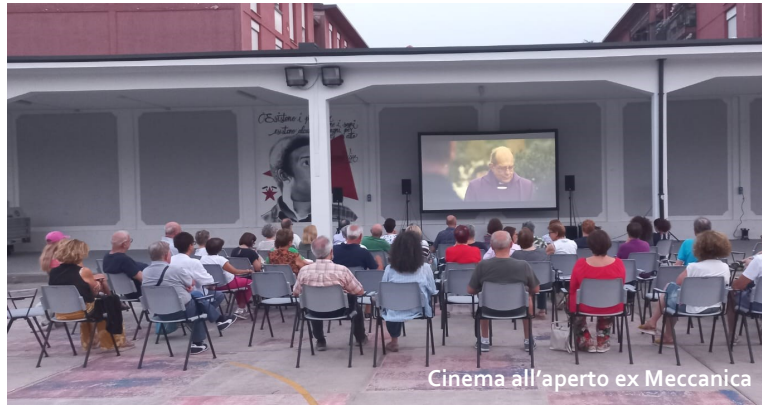
Cinema all'aperto ex Meccanica