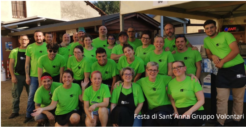
Festa di Sant'Anna Gruppo Volontari