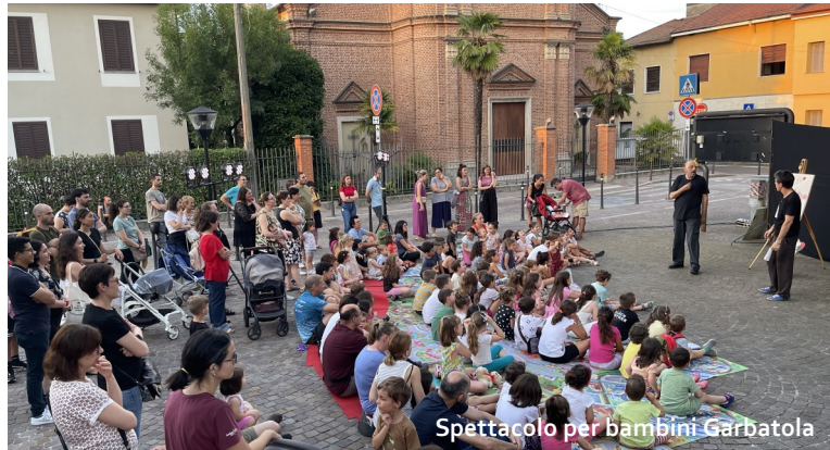
Spettacolo per bambini Garbatola