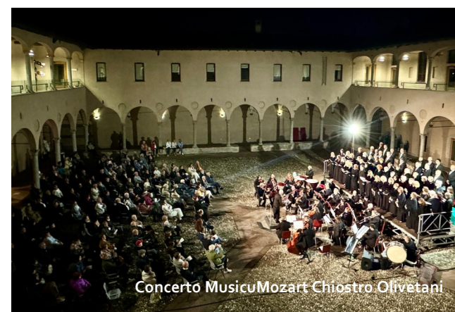
Concerto MusicuMozart Chiostru Olivetani