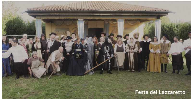
Festa del Lazzaretto